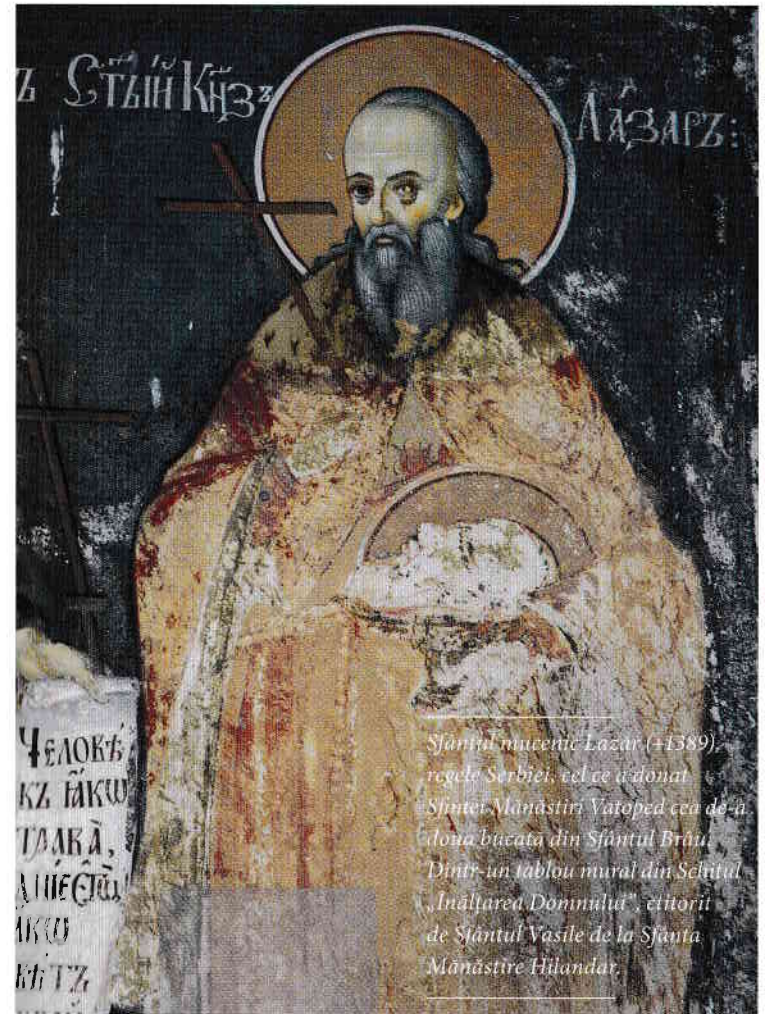
Sfântul mucenic Lazăr (+1389), regele Serbiei, cel ce a donat Sfintei Mănăstiri Vatoped cea de-a doua bucată din Sfântul Brău. Dintr-un tablou mural din Șchitul „Înălțarea Domnului”, etnorii de Sfântul Vasile de la Sfânta Mănăstire Hilandar.

Dăruitorul primei bucăți a Brăului a fost împăratul Ioan al VI-lea Cantacuzino (1341–1354), el dăruind această – cea mai mare – bucată din Sfântul Brău Mănăstirii Vatoped laolaltă cu multe alte odoare neprețuite, pentru care este și considerat unul dintre cei mai mari binefăcători ai mănăstirii. Mai târziu, Cantacuzino a abdicat de la tronul imperial și a fost tuns monah cu numele de Ioasaf. Cel mai probabil, a viețuit la Mănăstirea Vatoped. Există o ilustrație realizată în 1818 la