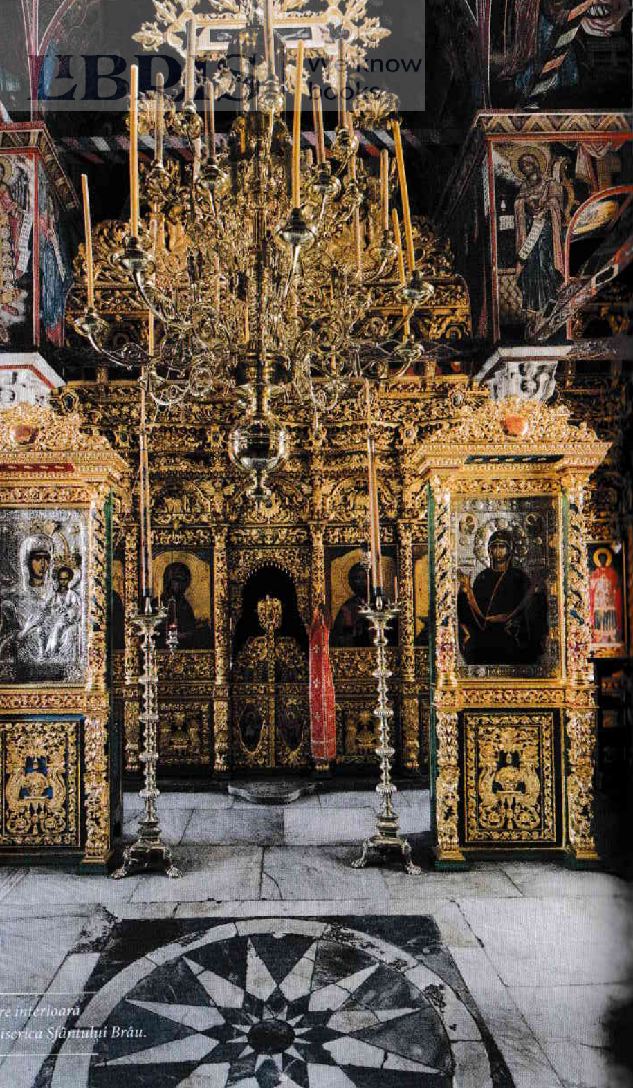
Interiorul Bisericii Sfântului Brâu.