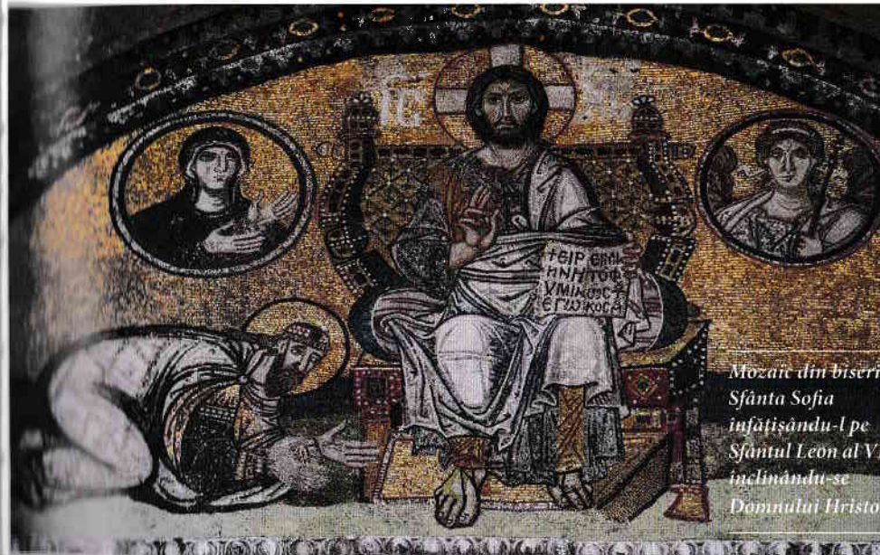
Mozaic din biserică Sfânta Sofia înfățișându-l pe Sfântul Leon al VI înclinându-se Domnului Hristos

Gherman I, Patriarhul Constantinopolului (715–730), descrie în versuri dumnezeiasca și veșnic-păstrata mireasmă a minunilor înfăptuite de Brău, care aduce bucurie celor ce se ating de el cu credință și cu evlavie. Iar Iosif Imnografal (cca. 816–866) laudă sfântul odor, care, prin harul Preasfintei Născătoare de Dumnezeu, îi sfințește pe cei care vin să o cinstească cu credincioșie, ridicându-i din stricăciune și izbăvindu-i de boli și de dureri.